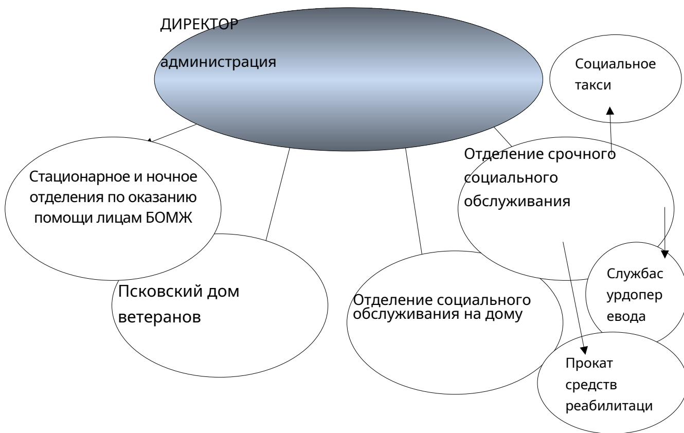
СХЕМА ВНУТРЕННЕЙ СТРУКТУРЫ УЧРЕЖДЕНИЯ

В состав Учреждения входят следующие отделения: